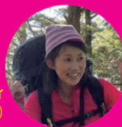
コマツティ (山ごはんの達人)