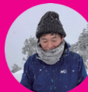
もーりー (企画・アテンド)