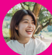
おかち (地域おこし 協力隊)