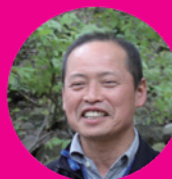
ワイルド (浅間山麓国際 自然学校インター プリター)