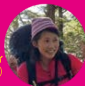
コマツティ (スタッフ)