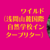
ワイルド (浅間山麓国際 自然学校イン タープリター)