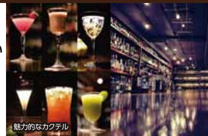
魅力的なカクテル おてなしメニュー ウイスキー800円~、カクテル1,000円~

極上のお酒を静かに スマートにお楽しみください 季節のフルーツを使ったカクテル やレアウイスキーなどをゆっ くりとお楽しみいただけるオー センティックバーです。