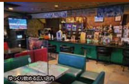
ゆっくり飲める広い店内 おてなしメニュー 90分飲み放題!(お一人様3,000円)

女性ひとりからでも安心してご 来店いただけます。ワイワイ飲 みながら、心ゆくまでお楽しみ いただける、アットホームなお 店です。皆様のご来店をお待ち しております。