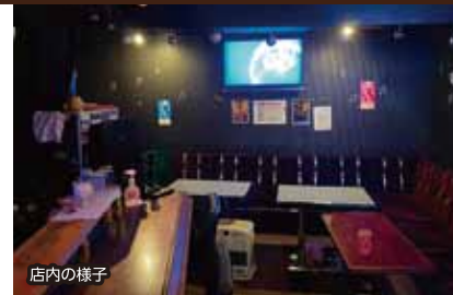
店内の様子 おてなしメニュー 飲み放題3,000円(90分)

日本酒、焼酎、サワー各種、ハイ ボールなど飲み放題で提供しま す。カラオケの得点に応じて各 種サービスを実施。また、「米コ ンクールで来た」と伝えていた だいた方にサービス致します。 ぜひ、お気軽にお越しください。