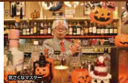
気さくなマスター おてなしメニュー カクテル500円~、ウイスキー500円~

地酒から本格カクテルまでリー ズナブルにご提供します。カラ オケ設備もあり、お客様のご要 望に応じたプランも承ります。 期間中は特別メニューを用意! 皆様のお越しをお待ちしてい ます。小諸の地で、素敵な雰囲気 をお楽しみください。