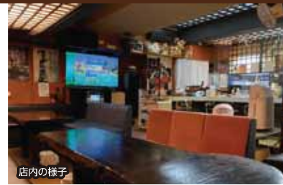
店内の様子 おてなしメニュー 飲み放題・歌い放題2,500円(2時間)

日本酒、ウイスキー、焼酎など 好きな物を飲み放題でご提 供します。カラオケは音響設備 も良く、気持ちよく歌ってい ただけます。お気軽にお越しき ださい。