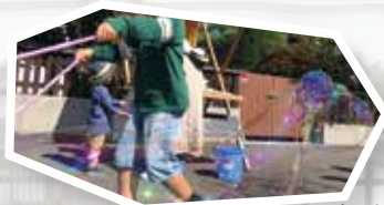
シャボン玉をしたり