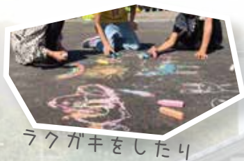
ラクガキをしたり