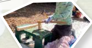
木工体験をしたり