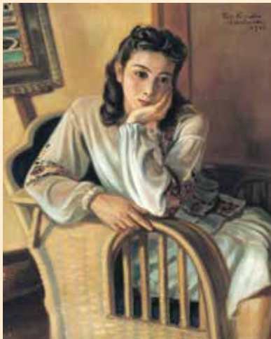
ブルーズ・ド・ブルガリイ

西洋の技術で日本の風景を描く主題として小山敬三が選んだのが白鷺城(姫路城)でした