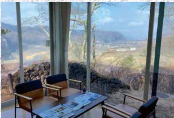
展望室からは千曲川が見下ろせ、晴れた日は北アルプスが望めます