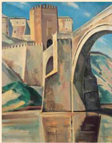
アルカンタラの橋