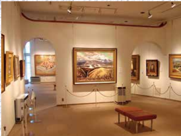
落ち着いた雰囲気展览展示室では、代表作の常設展と企画展示がご覧になれます