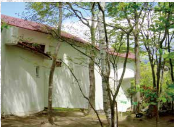
美術館は村野藤吾の設計で、小山敬三の作品と調和し、街にとけこむように作られた芸術性の高い建築です